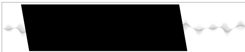
Obrázek 2: Detail označeného výřezu v obrázku 1 při pečlivějším a hlubším pohledu

Jenže ne, je to křivka! Stačí jenom opravdu pozorně vnímat a oprostít se od povrchního, řeklo by se hrubého nazírání.